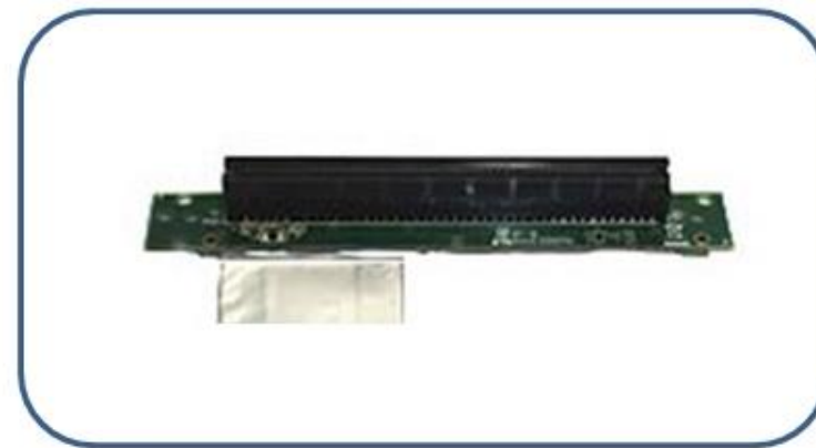
PCI Express 16x